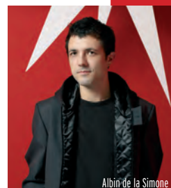
Albin de la Simone