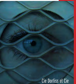
Cie Dorliss et Cie